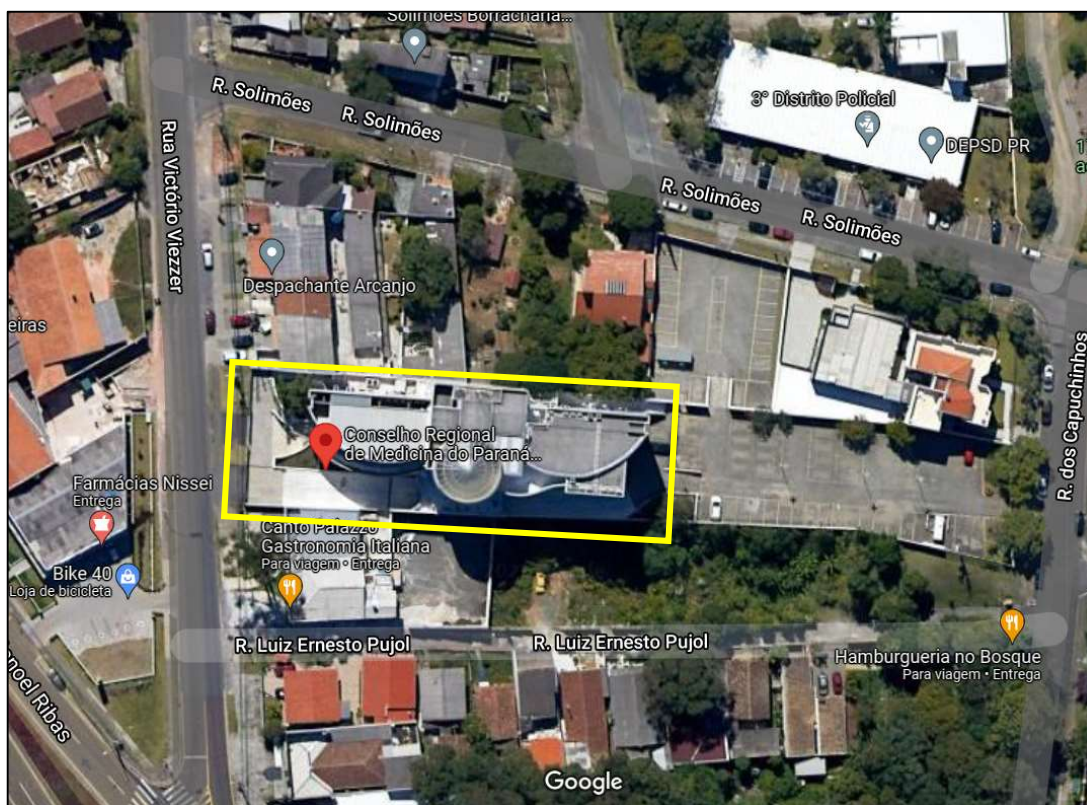
Imagem 01 – Localização CRM/PR.

A sede do CRM/PR fica localizada na rua Victório Viezzer, 84, bairro Vista Alegre, Curitiba/PR. A Imagem 01 abaixo apresenta a localização do CRM/PR por foto de satélite retirada da internet. A Imagem 02 apresenta um croqui esquemático dos locais que estão sendo apresentados neste relatório.